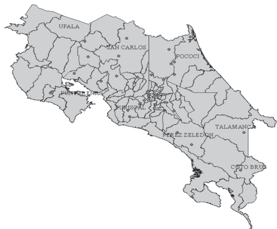
Cuadro 2. Distribución según cantón de pacientes con pruebas serológicas positivas de la AA, Costa Rica 2011